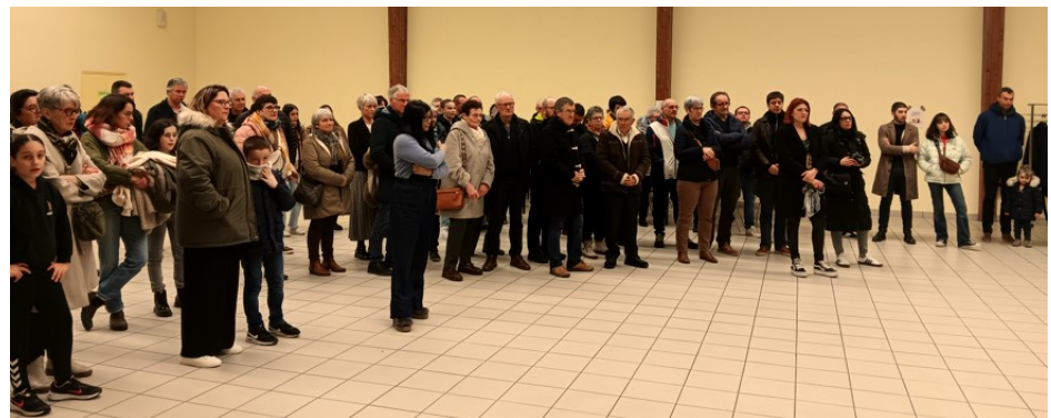
Cérémonie des vœux, le 10 janvier 2025.